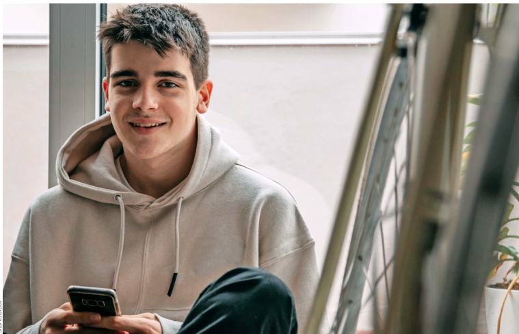
El osteosarcoma afecta, en su mayoría, a adolescentes y adultos jóvenes. También puede presentarse alrededor de los 65 años.

El osteosarcoma es un cáncer muy poco común y generalmente no se asocia a hábitos que puedan modificarse para prevenir su desarrollo. También suele detectarse en etapas avanzadas, lo que implica un gran reto para su manejo y tratamiento.